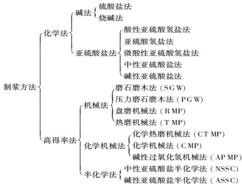
图 2 制浆方法分类

制浆方法可分为化学法、机械法以及介于二者之间的化学机械法、半化学法，具体分类方法见图 2。目前我国应用最广的制浆方法是硫酸盐法制浆、化学机械法制浆，主要产品为化学浆、漂白化学热磨机械浆（BCTMP）、碱性过氧化氢机械浆（APMP）等。